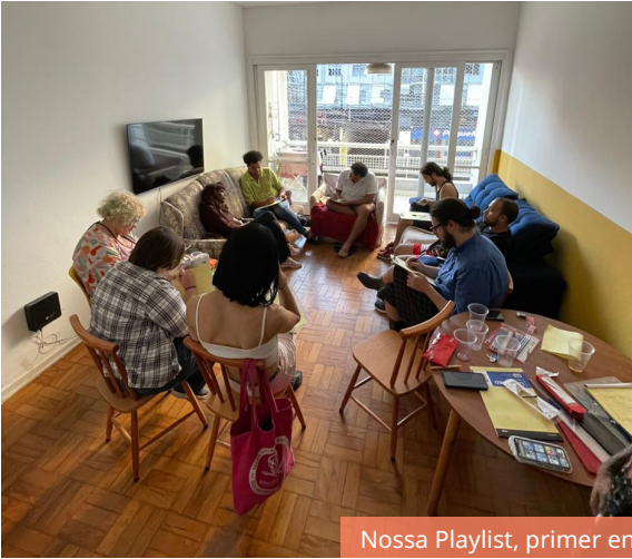
Nossa Playlist, primer encuentro, junio 2024.