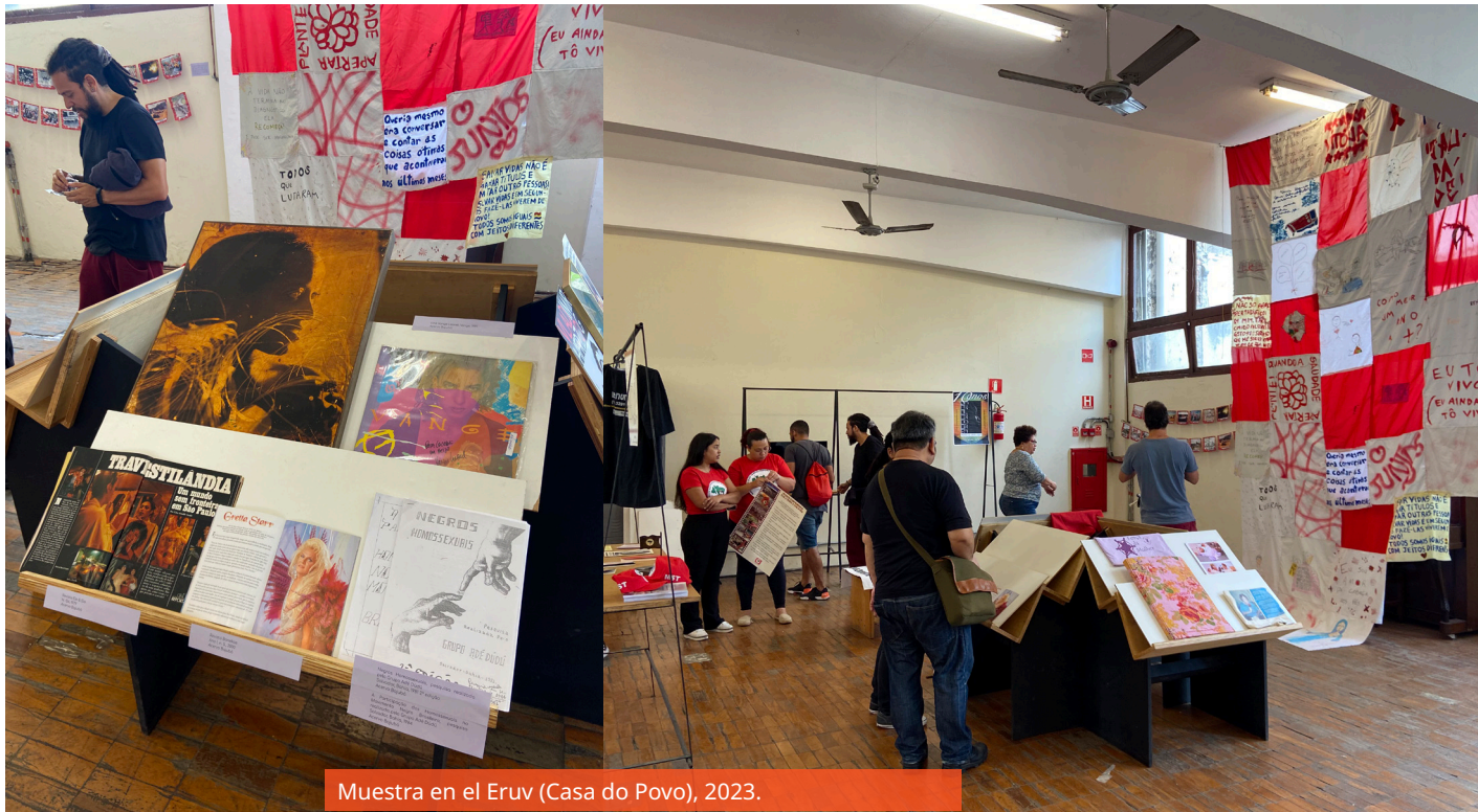
Muestra en el Eruv (Casa do Povo), 2023.