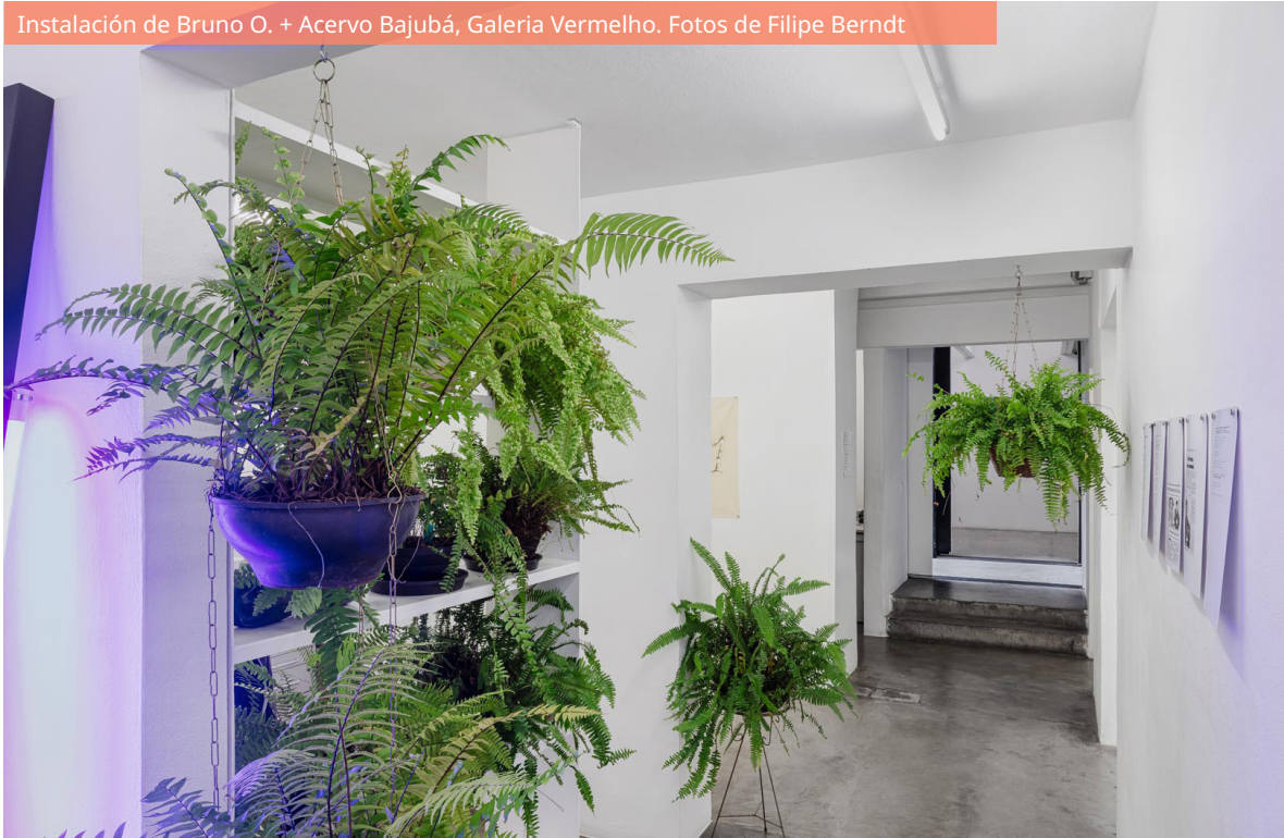
Instalación de Bruno O. + Acervo Bajubá, Galeria Vermelho.