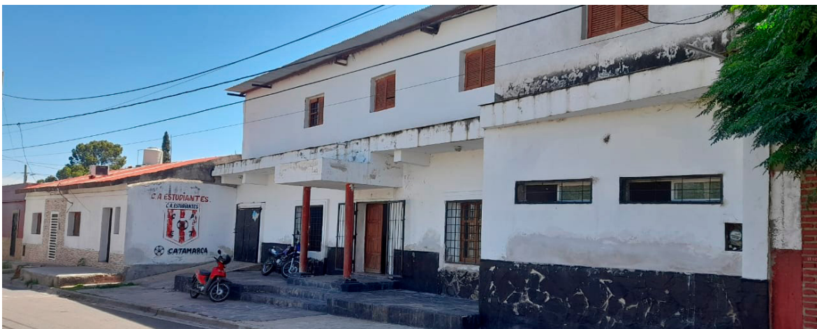
Figura 2: El Club Estudiantes de La Tablada.