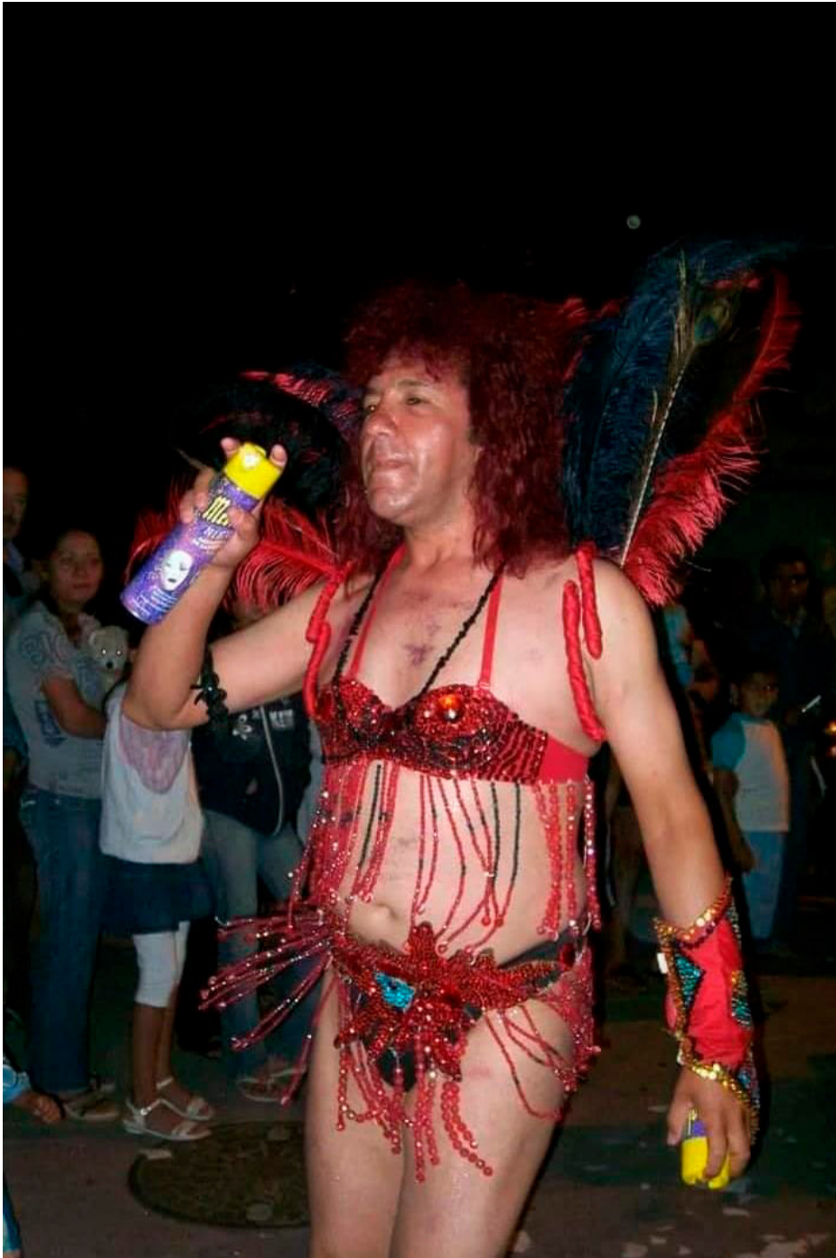
Figura 5: La Matosa en carnaval.

estas imágenes, todavía generaba enojo y espanto en una entrevistada, pues, para ella, “quizás sí, la gente no entiende nada, cómo es posible que no vean lo evidente y que los sigan votando” (J, vecina del Barrio Las Mil Viviendas, entrevista con Jorge Perea, 2017).