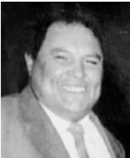
Figura 3: Recorte de la imagen de Matura Nieva.

En nuestra pesquisa por la red virtual también encontramos una segunda fotografía en blanco y negro que tiene una excelente resolución de píxeles (Figura 4). Sin embargo, no ha sido todavía replicada en otros post que evocan la trayectoria de Matura Nieva (Nieva, 2020). En esta imagen, la posición del cuerpo “toma otra forma” y no oculta los pliegues y las curvas. Matura nos mira y se muestra relajado, con un enorme mate en su mano como símbolo de la trama vivencial más sentida, más sensible y compartida con aquellas y aquellos vecinos donde se legitimaba y fortalecía su accionar político cotidiano.